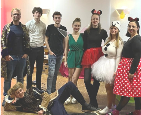
Das Osterfreizeit-Team 2024