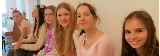
Das Team der Würfelgruppe