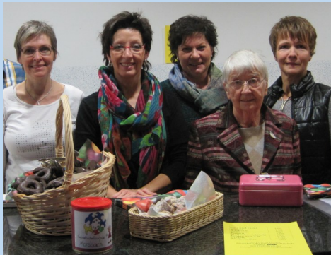
2014 | Bistro beim Konzert von „klub33“